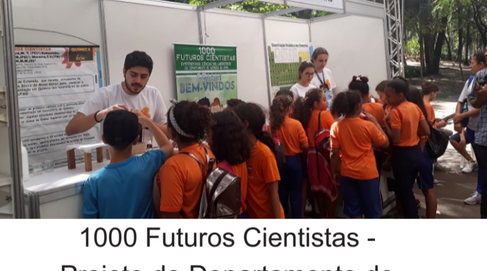
1000 Futuros Cientistas - Projeto do Departamento de Química da UFMG