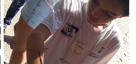
Estação Ecológica da UFMG