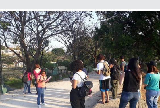
11/9 - Observação de aves e Preservação ambiental, no Parque Ecológico