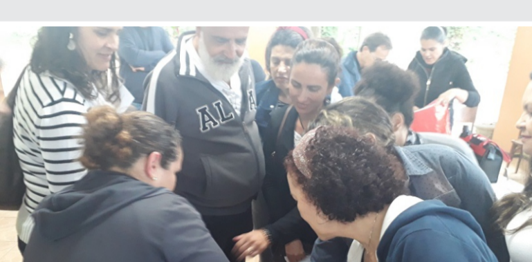
24 e 25/9- Reaproveitamento de resíduos e coleta seletiva, na Estação Ecológica da UFMG