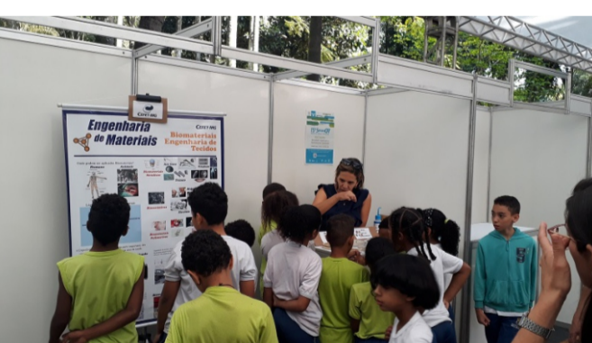
Curso de Engenharia de Materiais do CEFET - MG