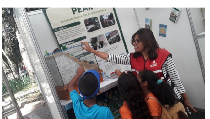
URBEL - Companhia Urbanizadora de Belo Horizonte