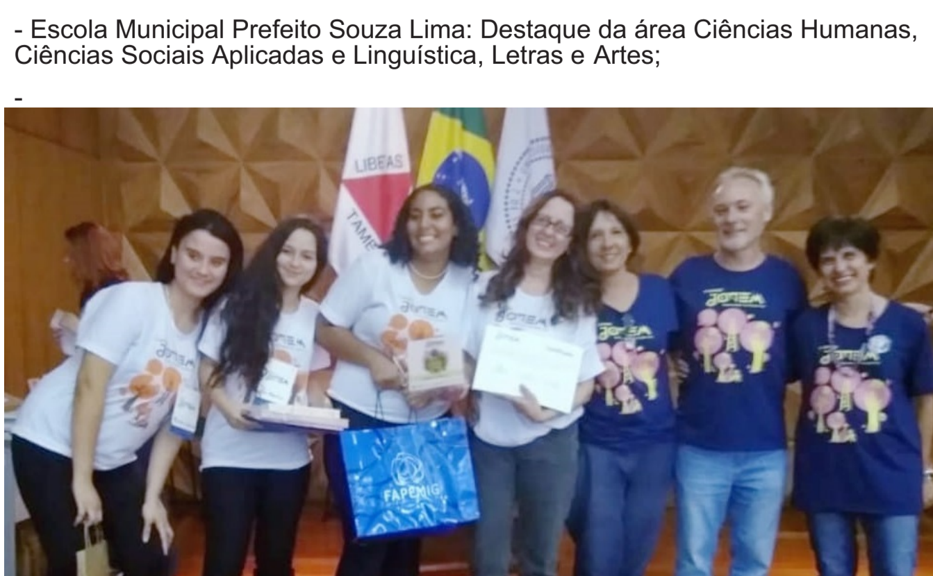
Premiação da Escola Municipal Paulo Mendes Campos Mídias influentes - Ressignificando conceitos