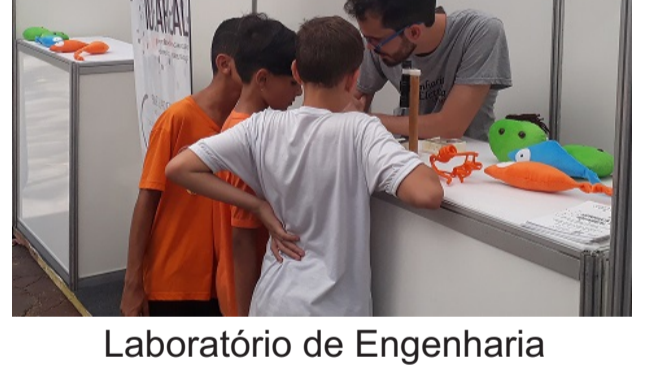
Laboratório de Engenharia Sintética e Bioengenharia do ICB - UFMG